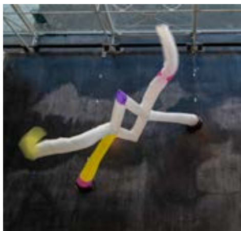
Vue de l'exposition

Sculpture gonflable, parachutes recyclés, ventilateurs industriels – env 3,5 x 6m