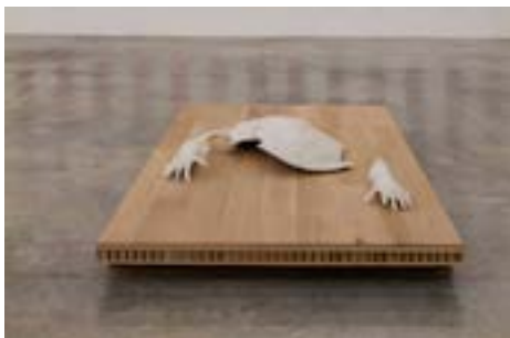
Vue de l'exposition

Porcelaine, feuille d'argent - 200 x 100 x 50 cm