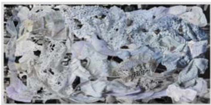
Eva Rosenstiel, place (weiss) , 2020

Den Spiegel der Welt hat Eva Rosenstiel auf dem Marché d'Aligre in Paris gefunden. Sie klebte die Fotos, die aus dem Markt aufnahm, auf Aluminiumfolie und malte darauf Berge von Stoffen und Kleidungsstücken. Diese Textilien stellen eine Verbindung zwischen dem Trubel des Ortes und ihrer persönlichen Geschichte her. Der öffentliche Raum lässt sich durch einen Filter der Intimität errahnen, den sie durch die Gewebe erzeugt.