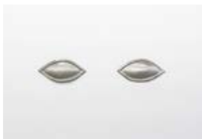
Vue de l'exposition

2 pièces en aluminium – 80 x 30 cm chacune