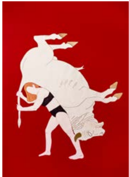
Hannah Cooke, Red Flag: Den Stier bei den Hörnern packen , 2023 © Hannah Cooke & VG Bild-Kunst, Bonn 2023