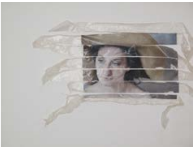
Miriam Wieser, Sans titre , 2012

Die weibliche Figur steht auch bei Nicole Hassler im Vordergrund. Die Künstlerin, die sich der radikalen Malerei verbunden fühlt, verwendet seit Jahren Kosmetika, um monochrome Bilder zu schaffen, die sich sowohl mit Farbe als auch mit dem Bild der Frau beschäftigen. In der Serie Art Lovers' Lipstick , die nach den Covid-Jahren entstand, bemalte sie 200 Holzquadrate, die sie mit Lippenstift bemalt hat. Hunderte von Lippenstiften wurden von Frauen gespendet, die während der Pandemie aufgrund der Maskenpflicht kein Make-up trugen. Jedes Werk trägt den Namen der Spenderin. Das Ergebnis ist ein Ensemble, das sowohl mit der Porträtmalerei als auch mit der reinen malerischen Geste verbunden ist.