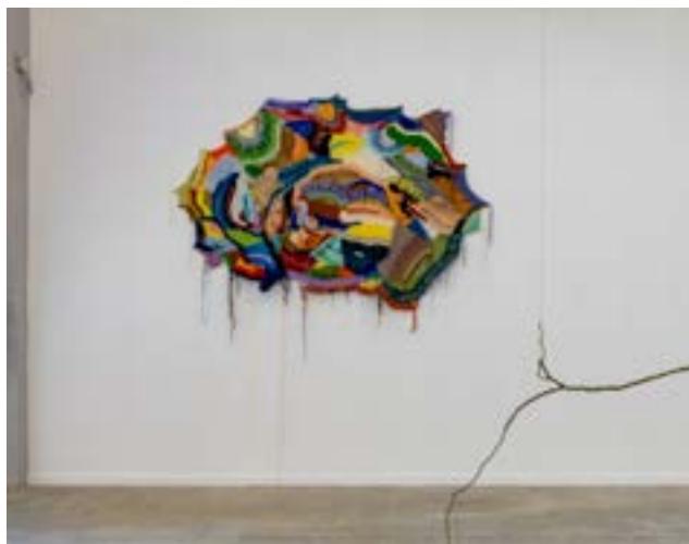
Vue de l'exposition

Pièce de tricot, fil et laine - 120 x 190 x 3 cm