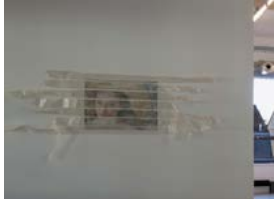
Vue de l'exposition

Miriam Wieser lebt und arbeitet in Freiburg (Deutschland). Nach einer Ausbildung zur Malerin an der Akademie der Bildenden Künste in Karlsruhe und eines Studiums der Romanistik an der Universität Freiburg widmete sie sich an der Staatlichen Akademie der Bildenden Künste in Stuttgart dem Design. Sie nahm hauptsächlich in Deutschland an verschiedenen Gruppenausstellungen teil.