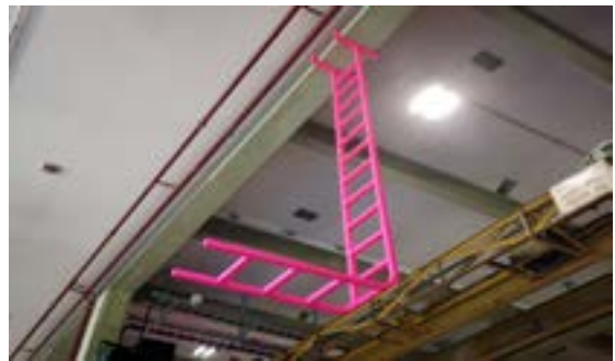
andreasschneider, quand je rêve je me sens très bien , 2023