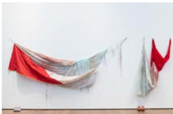
Kathrin Siegrist & Iva Wili, Dress for , 2022