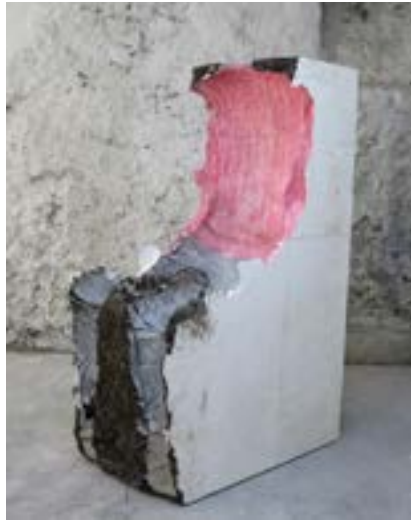
Elie Bouisson, Louis XVI , 2020