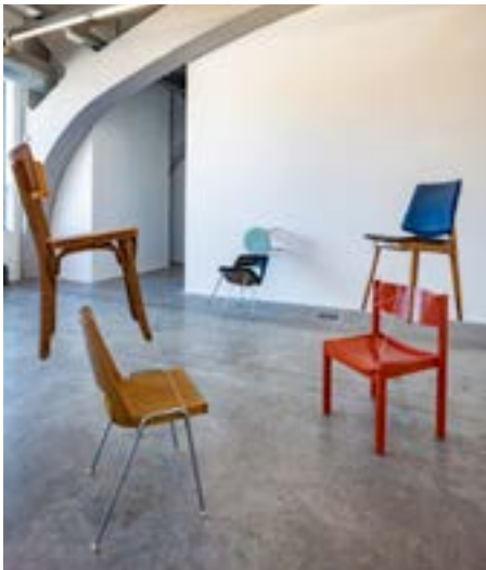
Vue de l'exposition

Während der Regionale ist ihre Arbeit auch im Kunsthaus L6 (Freiburg) zu sehen.