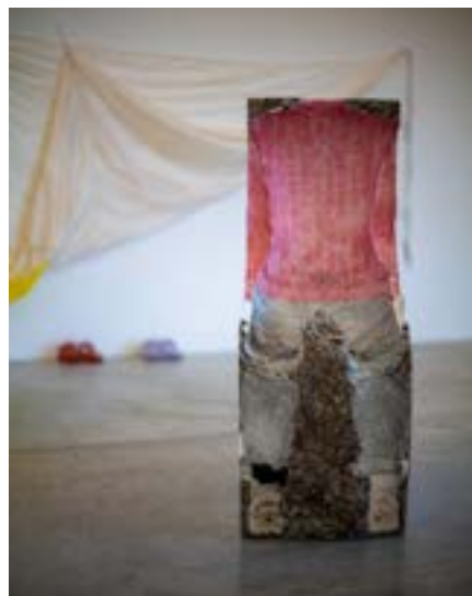
Vue de l'exposition

Il réalise également des projets in situ en fonction des particularités de certains lieux. Il s'est notamment manifesté sur une façade d'usine de café à Strasbourg ou dans la forêt de Savoillans (Haute-Provence) dans laquelle il met en place un ensemble de sculptures dans l'environnement.