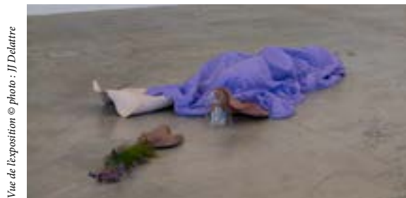
Vue de l'exposition

Im Zusammenhang mit den Problemen des digitalen Zeitalters erforscht sie die „Berührbarkeit“ von Materialien. Ihre Werke sind facettenreich und mehrdeutig, sie wecken Neugier und Erinnerungen. Trotz ihrer experimentellen und manchmal beinahe archaischen Aspekte bleiben sie immer aktuell.