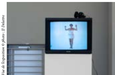
Vue de l'exposition

Pascale Grau, née en 1960 à Saint-Gall, vit et travaille à Bâle. Après avoir étudié l'espace scénique et la performance à la Hochschule für