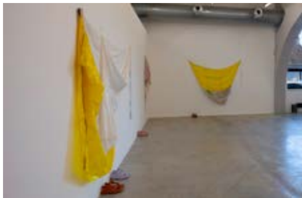
Vue de l'exposition

Segments de parapente, acrylique, huile, colorants, sandales, dimensions variables