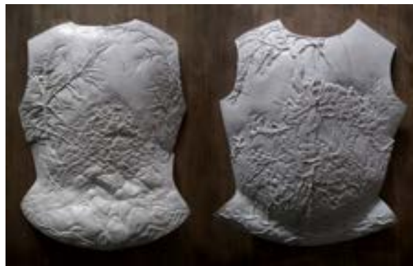
Valentine Cotte, Gisante (III) , Où serais-je demain , 2023 (œuvre en cours)